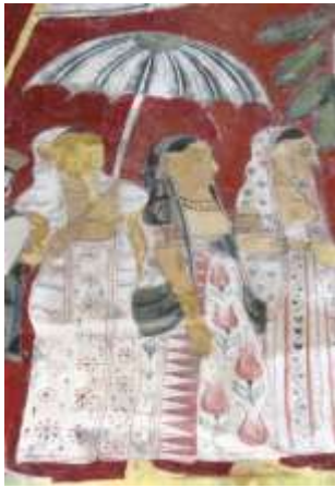
රූපය 01: ගර්භනී මහමායා දේවිය, බුද්ධ චරිතයේ අවස්ථාවක්, කතළව පූර්වාරාමය, ගාල්ල, 19වන සියවස පසු අවදිය

පර්යේෂණ සිදු කළ යුතුව ඇත. එමඟින් ස්ත්‍රීය පිළිබඳව වූ සමාජ ආකල්ප තවදුරටත් අනාවරණය කර ගැනීමට අවකාශය ලැබේ.