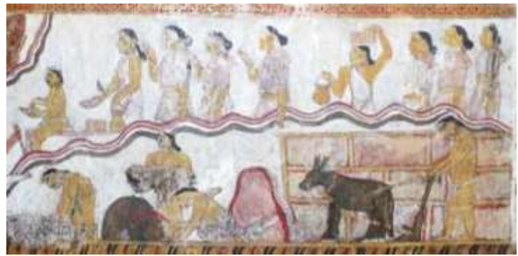
රූපය 11: ආහාර රැගෙන කුඹුරට යන කාන්තාවෝ, උරග ජාතකය, මිනිගමුව ටැම්පිට විහාරය, තුම්පනේ, ක්‍රි.ව. 18-19 සියවස