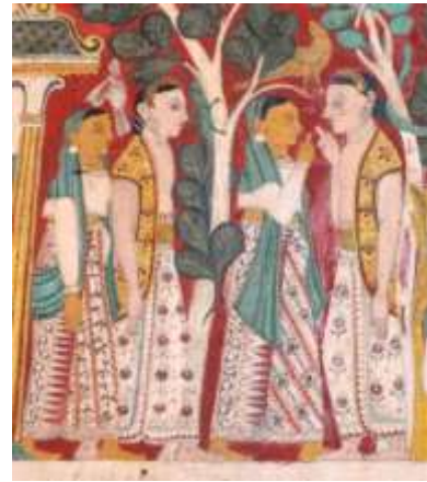
රූපය 02: ගර්භනී පටාවාරාව, බුද්ධ චරිතයේ අවස්ථාවක්, කතළව පූර්වාරාමය, ගාල්ල, 19වන සියවස පසු අවදිය