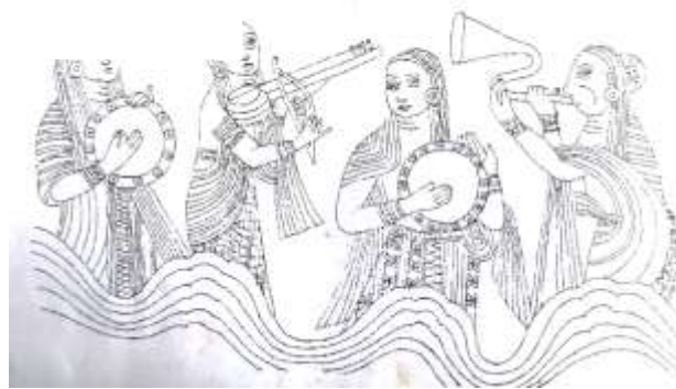
රූපය 12: සංගීත භාණ්ඩ වයන කාන්තාවෝ, තොටගමුව තෙල්වත්ත විහාරය, 19වන සියවස