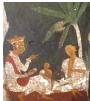
රූපය 04: වෙස්සන්තර රජු දරුවන්ට ආහාර කැවීම, වෙස්සන්තර ජාතකය, කැලණිය රජ මහා විහාරය, කැලණිය, 19වන සියවස පසු අවදිය