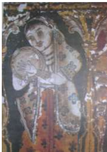
රූපය 13: දෙව්ලොව සංගීත භාණ්ඩයක් වයන කාන්තාවක්, සමුද්‍රගිරි විහාරය, මිරිස්ස, 19වන සියවස