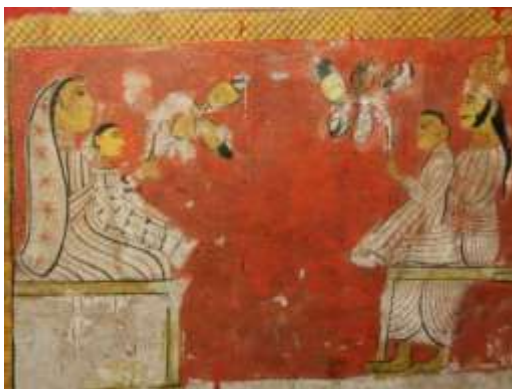
රූපය 03: වෙස්සන්තර රජු සහ බිසව දරුවන් සමඟ, වෙස්සන්තර ජාතකය, අරක්කන රජ මහා විහාරය, හඟුරන්කෙත, 18වන සියවස පසු අවදිය