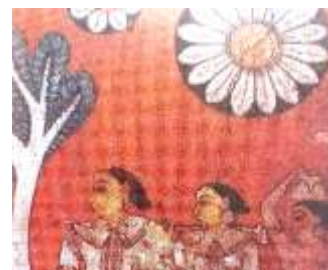
රූපය 06: ආහාර රැගෙන කුඹුරට යන, උරග ජාතකය, මැදවල ටැම්පිට විහාරය, මැදවල, ක්‍රි.ව. 1755