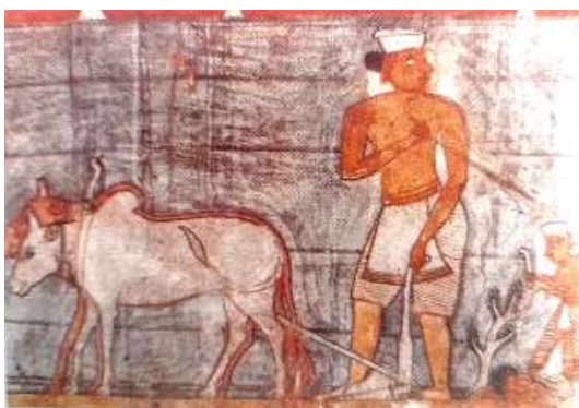
රූපය 05: ගොවියා සීසෑම, උරග ජාතකය, මැදවල ටැම්පිට විහාරය, මැදවල, ක්‍රි.ව. 1755