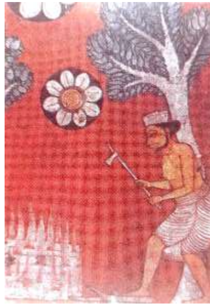
රූපය 08: ගොවියා අවමංගලය කටයුතු පිළිලෙ කිරීම, උරග ජාතකය, මැදවල ටැම්පිට විහාරය, මැදවල, ක්‍රි.ව. 1755