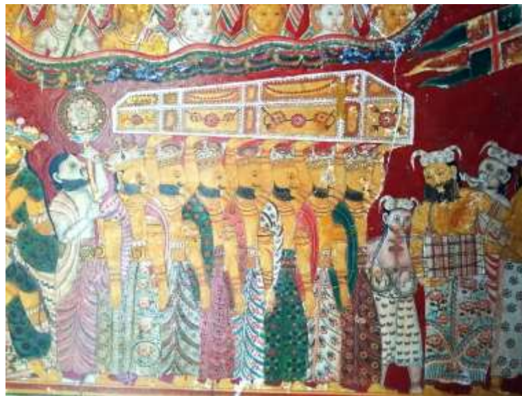
රූපය 09: බුදුන්වහන්සේගේ දේහය රැගත් අවමංගලය පෙරහැර, බුද්ධ වර්තය, නවමුණිසෑ විහාරය, කතළුව, ක්‍රි.ව. 19වන සියවස