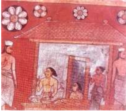
රූපය 10: නිවසෙහි සිටින කාන්තාවෝ, උරග ජාතකය, මැදවල ටැම්පිට විහාරය, මැදවල, ක්‍රි.ව. 1755