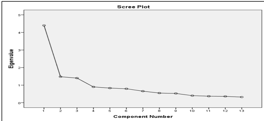
ප්‍රස්තාර සටහන 1: අයිගන් අගය Principal Component Analysis

සාධක විශ්ලේෂණයේ දී KMO සහ Bartlett's පරීක්ෂාව අවධානය යොමු කිරීමේ දී යොදාගනු ලබන දත්තවල වලංගුභාවය පරීක්ෂා කරයි. මෙහිදී KMO අගය මඟින් නියැදියේ ප්‍රමාණවත් බව සහ Bartlett's පරීක්ෂාව මඟින් නියැදියේ Sphericity පරීක්ෂා කරනු ලබයි. KMO අගය 0.05ට වඩා විශාල විය යුතු අතර Bartlett's අගයෙහි P අගය 0.05ට වඩා අඩු අගයක් ගත යුතුය. මෙම අධ්‍යයනය අනුව KMO අගය 0.832 වන අතර Bartlett's අගයෙහි P අගය 0.000 වේ. එනම් 0.05 ට අඩු බැවින් මෙම සාධක විශ්ලේෂණය අධ්‍යයනය සඳහා යෝග්‍ය වේ.