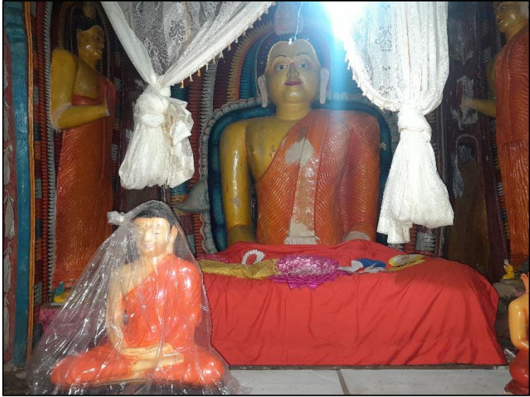
ජායාරූප අංක 06: හිඳි පිළිමය