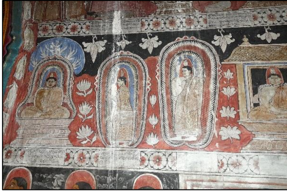
ජායාරූප අංක 03: සත්සතිය දැකවෙනු ලබන සිතුවමින් කොටසක් (මූලාශ්‍රය: 13.08.2022 වන දින ක්‍ෂේත්‍ර අධ්‍යයනය)

සයවෙනි සතිය තුළ දී මුවලින්ද නාග දරණයෙහි ගත කළ අවස්ථාව නිරූපණය කිරීමේ දී මුවලින්ද නාරජු දෙපස පෙණය ඔසවාගෙන සිටින නාගයන් තිදෙනෙකු බැගින් සය දෙනෙකු සිතුවම් කර තිබීම විශේෂයකි. ඒ අනුව එහි නාගයන් සත් දෙනෙකු ම දැකගත හැකිය. එම නාගයන් වර්ණ ගැන්වීම සඳහා ද නිල් සහ සුදු වර්ණය යොදා ගැනීමට විත්‍ර ශිල්පියා කටයුතු කර ඇත.