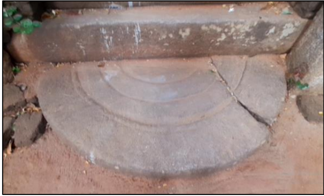
ඡායාරූප අංක 01 : විහාර භූමියේ ඇති ඉපැරණි සඳකඩපහණක් (මූලාශ්‍රය - 13.08.2022 වන දින ක්‍ෂේත්‍ර අධ්‍යයනය)