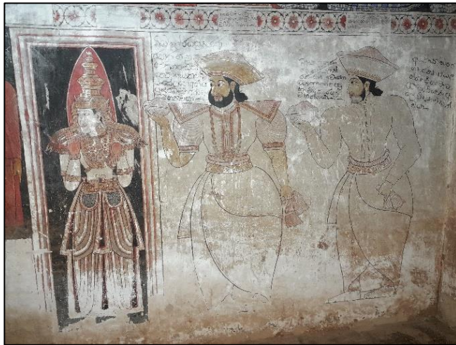
ඡායාරූප අංක 04: විහාරය ආරම්භ කිරීමට දායක වූ පුද්ගලයන් ලෙස සිතිය හැකිය

ලෙසටය. අනෙක් දෙදෙනාගේ නම් එතරම් පැහැදිලි නොවන අතර කෙසේ වෙතත් ඒ කොරලේ මහත්මයෙකු, විදානේ මහත්මයකු සහ ආරච්චි මහත්මයකු බව පෙනේ. පැවිදි තෙරුන් වහන්සේ තිදෙනා බොල්ගල්ලේ සුමංගල, වත්තේගම සුමන, මුළුපනේ පියදස්සි ලෙස නම් කර ඇත. එම නම් සඳහන් කර ඇත්තේ උභවහගේ (උන්වහන්සේ) යනුවෙනි.