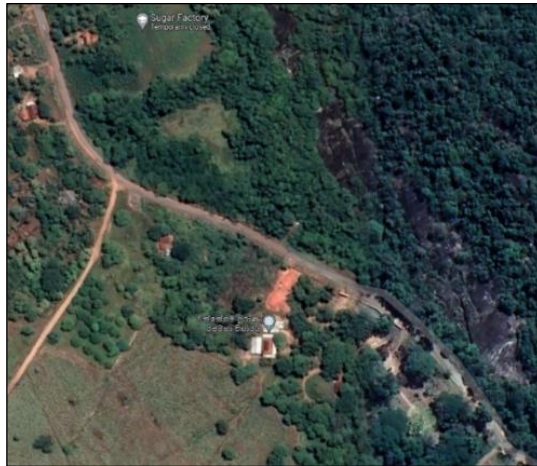
සිතියම් අංක 01: වත්තේගම පුරාණ විහාරය Google Map ඔස්සේ නිරීක්ෂණය කරන විට දිස්වන ආකාරය (මූලාශ්‍රය - අන්තර්ජාලය ඇසුරෙන් උපුටා ගන්නා ලද්දකි)

අක්ෂාංශ දේශාංශ අනුව මෙහි පිහිටීම 6^{\circ}47'30.2''N , 81^{\circ}30'13.0''E ලෙස පෙන්වාදිය හැකිය.