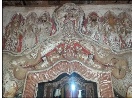
ඡායාරූප අංක 02: මකර තොරණ