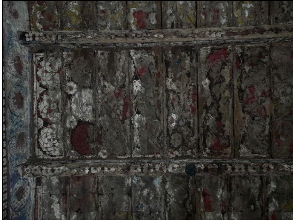
ඡායාරූප අංක 05: විහාර මන්දිරයේ සිවිලිම තුළ සිතුවම් කර ඇති සිතුවම් (මූලාශ්‍රය - 13.08.2022 වන දින ක්ෂේත්‍ර අධ්‍යයනය)