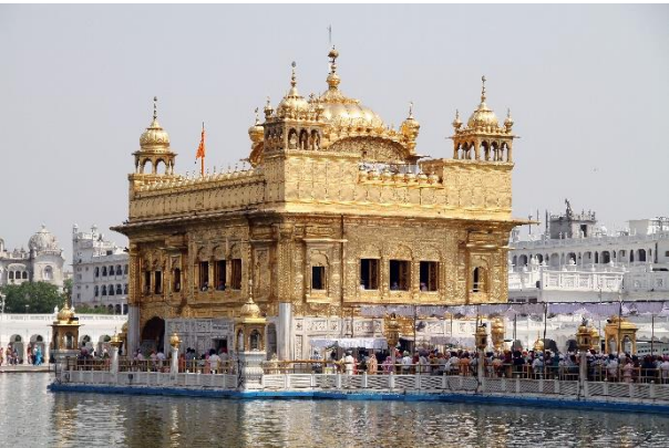
ඡායාරූපය 1 - රන් දෙවොල

තනතුරට පත්වීමත් සමග හැඳින්වූයේ ගුරු රාමදාස් (1574-1581) යන නමිනි. ඔහු අතින් සිදු වූ වැදගත්ම කාර්යය වශයෙන් සැලකෙන්නේ ගුරු අංගද් දේවගේ සිහිනය වූ සික්වරුන්ගේ ශුද්ධ නගරය ගොඩනංවා අවසන් කිරීමයි. වර්ෂ 1574 දී නගරයේ ඉදිකිරීම් කටයුතු අවසන් කළ ගුරු රාමදාස් එහි පදිංචියට පැමිණි අතර එකල 'ගුරු-දා-වක්' නමින් හැඳින්වුණු නගරය පසුව 'වක් රාමදාස්' නමින් ද, වර්තමානයේදී 'අම්රිත්සාර්' යන නමින් ද ප්‍රකට වී තිබේ. ගුරු රාමදාස් විසින් නගරය තුළ 'හර්මන්දිර් සහිබ්' (දෙවියන්ගේ මන්දිරය) නමින් මන්දිරයක් ඉදිකරවූ අතර වර්තමානයේදී එය 'දර්බාර් සහිබ්' හෙවත් රන් දෙවොල නමින් ප්‍රකට ය ( The New Encyclopaedia Britannica Vol. 27, 2010:286 ) (ඡායාරූපය 1).