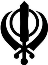
ඡායාරූපය 2 - සික්වරුන්ගේ ලාංඡනය ( https://en.wikipedia.org/wiki/Sikh )

බලයක්, හර්මන්දිර් සහිත කුලින් ගුරුගේ අධ්‍යාත්මික නායකත්වයක් පිළිබිඹු කෙරෙන බව ප්‍රකාශ කළ හෙයින් සික්වරුන් ඔහුව 'සව පශාන්' නම් විරුදයෙන් හඳුන්වා තිබේ ( The New Encyclopaedia Britannica Vol. 27, 2010:286 ). ක්‍රමයෙන් සික්වරුන් යුධකාමීන් බවට පත් කළ ගුරු හර්ගෝබින්ද් තම ලාංඡනය සකසා ගත්තේ ඡත්‍රයක්, කල්ගියක් (කිණිස්සක්) සහ මිරි හා පිරි සංකේතවත් කරන කඩු දෙක යොදා ගනිමිනි. අද දක්වාම සික්වරුන්ගේ සලකුණ වශයෙන් භාවිතා වන්නේ එයයි (පින්තු, 2002:210) (ඡායාරූපය 2).