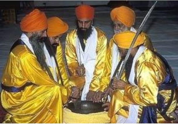
ඡායාරූපය 3 - බල්සා වාරිකුය

අනතුරුව ජලය දැමූ යකඩ බඳුනකට 'පටඟස්' හෙවත් පංජාබයේ ඇති රස ගන්වන දේ එක්කොට ආදි ග්‍රන්ථි ගිනිකා ගයමින් තම කඩුවෙන් කැලතු ගුරු ගෝබින්ද් මෙම රස ගැන්වූ ජලය හා යකඩ මිශ්‍ර වූ දියරය 'අම්රිත්' හෙවත් අමෘතය වශයෙන් නම්කොට තම කඩුවෙන් එය ගෝලයන්ට ඉසිමින් ඔවුන්ව පාරිශුද්ධ තත්ත්වයට පත් කළේ ය. එතැන් පටන් 'පාන්චි පියාරා' (ආදරණීය පස් දෙනා) යන නාමයෙන් ඔවුන්ව හැඳින්විය යුතු බවට නියම කළ ගුරු ගෝබින්ද් විසින් ඔවුන් 'බල්සා' හෙවත් පාරිශුද්ධ පුද්ගලයන් වශයෙන් නම් කරන ලදී. එසේම එතැන් පටන් බල්සාවට ඇතුළත් වන පුරුෂයන්ගේ නම අවසානයට 'සිං' හෙවත් සිංහයා යන යෙදුමත්, කාන්තාවන්ගේ නම අවසානයට 'කවුර්' හෙවත් කුමාරි යන යෙදුමත් භාවිත කිරීමට ගුරු නියම කළේ ය (The New Encyclopaedia Britannica Vol. 27, 2010:287).