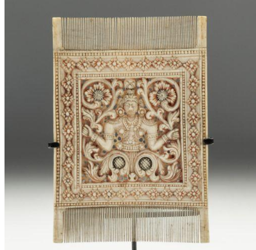
දැන් දළ පනාව

ශ්‍රී ලංකාවේ දැන් දන් කැටයම් කලාවට දීර්ඝ ඉතිහාසයක් ඇති බවට හමු වී ඇති සාධකවලින් අනාවරණය කරගැනීමට හැකි වී ඇත. ජෙට්ටිනිස්ස රජු විසින් දැන් දන් කැටයම් කලාවේ විශිෂ්ට නිර්මාණයන් කළ බව සඳහන්වේ (මහාවංශය 2004 පරි-37; 100-103). නමුදු මේ පිළිබඳව පුරාවිද්‍යාත්මක සාධක නොවූවද මෙම යුගය වන විට දැන් දන් කර්මාන්තයෙහි ප්‍රවීණයන් සිටි බවත් ඒ ආශ්‍රිත කැටයම් කලාව වර්ධනය අවධියක් තිබූ බවත් පිළිගැනීමට හැකිවේ.