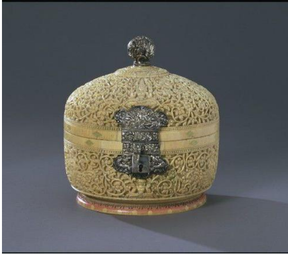
දැන් දළ මංජුසාව