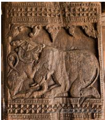
ඇම්බැක්කේ ලී කැටයම

පළමු රූපයේ දැක්වෙන කැටයම නිදහස් ආකාරයෙන් නිර්මාණය කර ඇත. දෙවන ඡායාරූපයේ දැක්වෙන අලියාගේ රූපය පමණට වඩා හකුළුවා තිබීම පතේලයේ හතරැස් සීමාවට ම සීමා වීමේ දැඩි අවශ්‍යතාවය පෙන්වයි. වන්දනා කිරීම සඳහා ඇතෙකු හෝ අලියෙකු දණ නමා ගත් විට හොඳය ඉහළට ඔසවා ගනී. මෙම කැටයමේ අභිප්‍රාය අලියා වන්දමාන කිරීම දැක්වීම වුවත් සාමාන්‍යයෙන් හස්තීන්ගේ වන්දනාමාන ශෛලිය මෙය නොවේ. ඒ අනුව කැටයම් පරිශ්‍රයේ ඇති අවකාශය සීමා වී කැටයම නිර්මාණය කර ඇත. සාම්ප්‍රදායික කැටයම් ශිල්පියා ගෘහ නිර්මාණ ආශ්‍රිතව පතේලය තුළට කෙතරම් සීමා වී ඇති ද යන්න සිරිගල හා නාවින්න රජ මහා විහාරයේ ඇතෙකු දැක්වෙන කැටයමෙන් පැහැදිලි වේ.