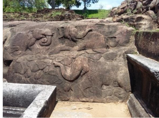
අනුරාධපුර රන්මසු උයන

නිශ්ශංකමල්ල රජු දවස කරවන ලද පොළොන්නරුව ගල්පොත ශිලා ලිපියෙහි ඇතුන් දෙදෙනෙකු නමස්කාර කරන ලක්ෂ්මී දේවියගේ රුව ද දැකිය හැකිය.