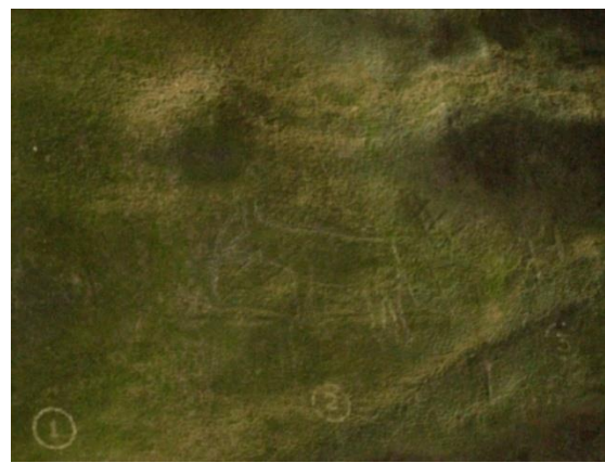
දොරවක ලෙනෙහි හස්තියා යැයි සැලකෙන සටහන

හස්තියා යොදාගැනීම පිළිබඳව අවධානය යොමු කිරීමේ දී අනුරාධපුරයේ ඉසුරුමුණිය ඇත් රූපයත්, නෙළුම් පොකුණේ ජල ක්‍රීඩාවේ යෙදෙන