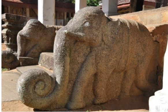
දඹදෙනිය විජයසුන්දරාරාමය විහාරය

ඇත් සමූහයක් වැදගත් වේ. දිය කෙළිනා ඇතුන් සොබෙන් වතුර ඉසින ඉරියව් සහිත ඇත් රංචුවක් මෙහි කැටයම් කොට තිබේ.